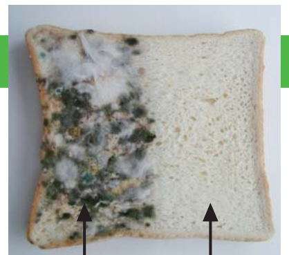
スーパーオール254未塗布 スーパーオール254塗布済